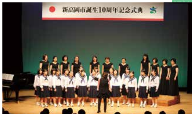
市民の歌「ふるさと高岡」合唱 新市誕生10周年記念式典

県が策定した地域再生計画に記載されている地方活力向上地域において、地方拠点の強化・拡充を行う企業を支援