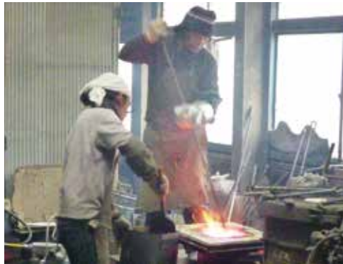
高岡の鋳物製作技術で釈迦三尊像を再現

策・事業を示しているが、高岡ならではのまち・ひと・しごこの創生とは。 市長 本市の強みであるものづくりを基盤として魅力的な仕事を創り出すことにより多様な人を引きつけ、新たな仕事を生み出すという好循環を確立したい。好循環を支えるまちにこれまで培ってきた文化力とそこに内在する創造性や革新性を通じて活力を呼び起こす。このような発展型・循環型のまち・ひと・しごと創生が文化創造都市高岡ならではのものと考える。