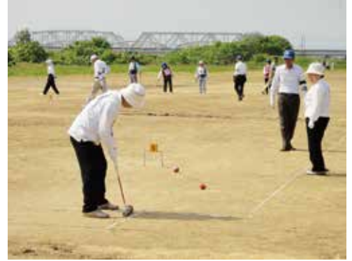
健康寿命の延伸で笑顔あふれるまち高岡へ

密着型サービスが9590人、施設サービスが2万3108人である。第6期介護保険事業計画では、日常生活圏域ごとに地域密着型サービス施設を複数配置することを基本として整備を進めており、各圏域の要介護認定者数や認知症