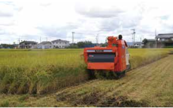
高岡産米の品質向上でブランドの確立を

(2)本市の平成27年産米の作柄や品質の状況に対する評価は。また、気象条件や害虫問題など予測困難な課題への対応が求められるが、高岡産米の作柄や品質の維持・向上に向けた今後の課題と対策は。 産業振興部長 (1)おいしいコメとしてのブランドの確立に加え、新鮮で安心な農作物の産地化に努めるなど、足腰の