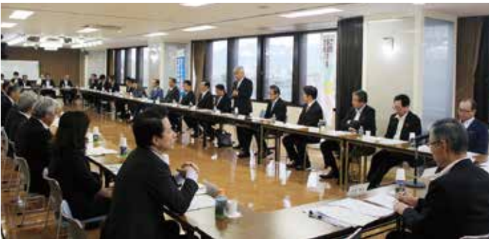
県西部一丸で要望 北陸新幹線新高岡駅「かがやき」停車実現期成同盟会

問 多くの市町村が、魅力ある商品を納税者に提供することで、税収を増やそうとしているが、本市のふるさと納税のPRや特典の充実による歳