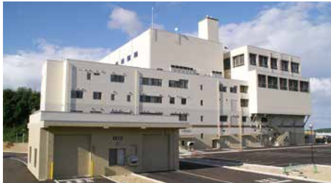
ごみ処理の拠点 高岡広域エコ・クリーンセンター

会行事等で排出されたごみは、事業系一般廃棄物として取り扱うのではなく、再考の余地があると考えるが、見解は。