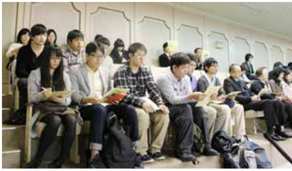
18歳選挙権へ 大学生が傍聴